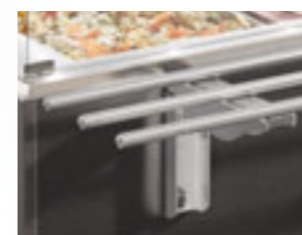
Scorriavassoio (mod. Service) S/S tray slide (Service model)