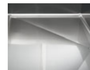
Pulizia ed igiene garantiti dal fondo arrotondato e diamantato Rounded diamond-cut bottom and water drainage for complete hygiene