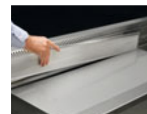
Facile pulizia ed igiene del vano evaporatore Evaporator compartment easy to inspect and to clean