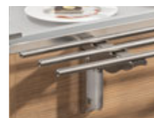
Scorriavaso (mod. Service) S/S tray slide (Service model)