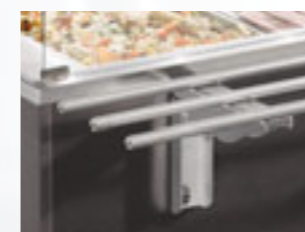
Scorriavassoio (mod. Service) S/S tray slide (Service model)