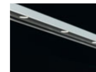
Illuminazione a LED LED lighting