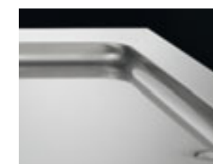
Pulizia ed igiene garantiti dal fondo arrotondato e dallo scarico Rounded bottom and water drainage for complete hygiene