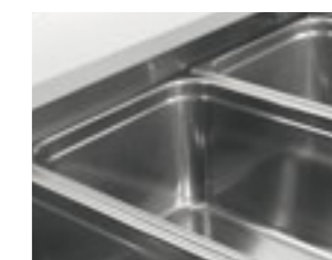
Alloggiamento ribassato delle vaschette per un miglior mantenimento del cibo fresco Better food conservation also on the top of pan