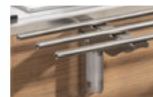
Scorivassoio (mod. Service) S/S tray slide (Service model)