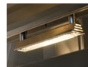
Lampade alogene riscaldanti Hot halogen lamps