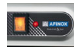
Spia rossa accesa: mancanza acqua