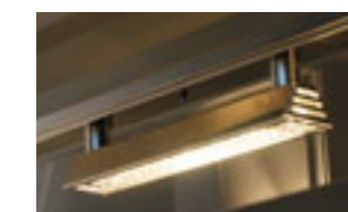
Lampade alogene riscaldanti Hot halogen lamps