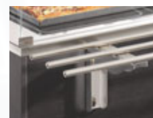
Scorivassoio (mod. Service) S/S tray slide (Service model)