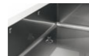
Pulizia ed igiene garantiti dal fondo arrotondato e scarico con tubo troppopieno Rounded bottom and water drainage for complete hygiene