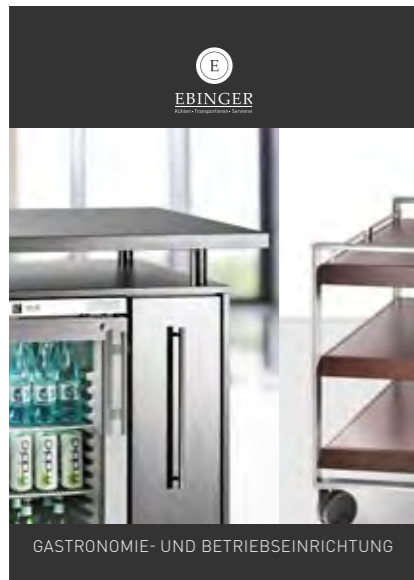
GASTRONOMIE- UND BETRIEBSEINRICHTUNG

HIER FINDEN SIE WEITERE EBINGER QUALITÄTSPRODUKTE OTHER EBINGER QUALITY PRODUCTS