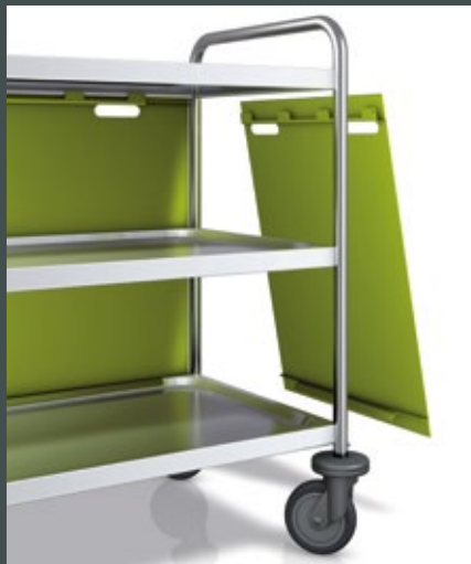
Die Seitenwände Einfach einhängen und genauso einfach wieder abnehmen.

Außer in Edelstahl gibt es die Verkleidung in dreizehn ausgewählten Farben, die den Servierwagen in jeder Umgebung zum attraktiven „Hingucker“ machen.